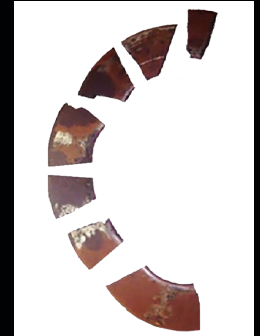
Ressort disque défaillant