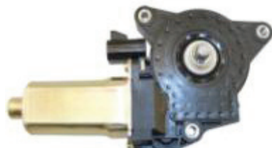
N° de pièce Professional 11M159 LeSabre 2000 à 2005 de Buick Bonneville 2000 à 2005 de Pontiac Moteur de lève-glace électrique, avant gauche et arrière droit