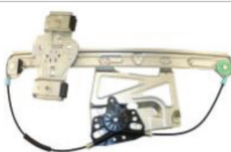
N° de pièce Professional 11R300 Deville 1997 et 2005 de Cadillac Lève-glace électrique, avant droit