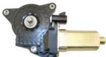
N° de pièce Professional 11M160 LeSabre 2000 à 2005 de Buick Bonneville 2000 à 2005 de Pontiac Moteur de lève-glace électrique, avant droit et arrière gauche

Fiez-vous à ACDelco ; nous avons les pièces qu'il vous faut.