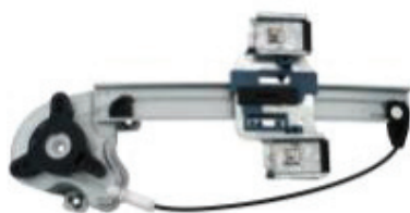
N° de pièce Professional 11R40 Bonneville 2000 à 2005 de Pontiac Lève-glace électrique, arrière droit