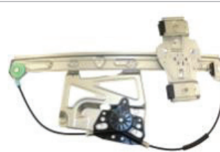
N° de pièce Professional 11R299 Deville 1997 et 2005 de Cadillac Lève-glace électrique, avant gauche