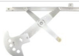
N° de pièce Professional 11R298 Malibu 1997 à 2005 de Chevrolet Classic 2004 et 2007 de Chevrolet Lève-glace électrique, avant droit

Lève-glaces et moteurs d'origine et Professional