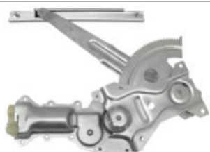
N° de pièce Professional 11A56 Grand AM 1992 à 1998 de Pontiac Achieva 1992 à 1998 d'Oldsmobile Moteur et lève-glace, arrière droit