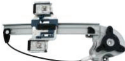
N° de pièce Professional 11R439 Bonneville 2000 à 2005 de Pontiac Lève-glace électrique, arrière gauche