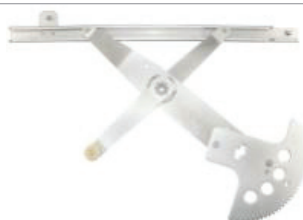
N° de pièce d'origine N° de pièce Professional 11R297 Malibu 1997 à 2005 de Chevrolet Classic 2004 et 2007 de Chevrolet Lève-glace électrique, avant gauche

Avec 1 127 pièces qui conviennent parfaitement, du premier coup.