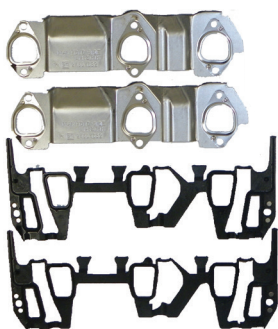
TROUSSE DE JOINTS DE CULASSE