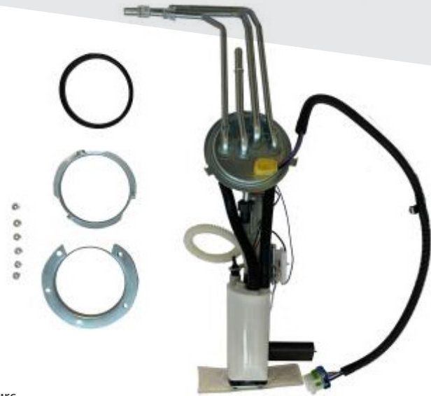
MODULE D'ASSEMBLAGE DU RÉSERVOIR DE POMPE À CARBURANT