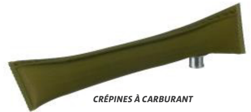
CRÉPINES À CARBURANT